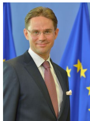
Jyrki Katainen Europese Commissie Vicevoorzitter voor Banen, Groei, Investerings en Concurrentievermogen

Het is van cruciaal belang dat onze overheidsinkopers het juiste evenwicht vinden tussen openheid en een gelijk speelveld. Het EU-kader voor overheidsopdrachten biedt hun reeds een volledig en flexibel instrumentarium. Deze richtsnoeren geven hun het vertrouwen om dat instrumentarium te gebruiken om het evenwicht daadwerkelijk te bereiken.