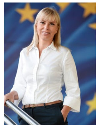
Elżbieta Bieńkowska Europees commissaris voor Interne Markt, Industrie, Ondernemerschap en Midden- en Kleinbedrijf